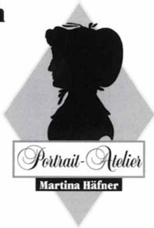
Foto-Arbeiten Filme Zubehör

Hauptstraße 65 · 63619 Bad Orb · Telefon: 0 60 52-71 71